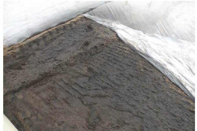
Solarizzazione integrata: “effetto collettore solare” garantito da uno strato di colore nero costituito da materiale biodegradabile, polvere di carbone vegetale e film solarizzante.

«Gli ingredienti per avere i migliori risultati possibili sono: un film coprente con elevate proprietà ottiche e termiche, l'applicazione rigorosa del protocollo (irrigazione a tenuta ermetica del telo), serra chiusa e un tempo di esercizio di almeno 40/50 giorni, da ritagliare tra giugno e agosto. Il ruolo del film solarizzante è centrale per conseguire ottimi risultati finalizzati alla sterilizzazione del terreno con l'eliminazione degli agenti patogeni “negativi”, fino alla profondità di almeno 40 cm. Un film “ideale” è in grado di trasmettere tutta la radiazione solare al terreno, specialmente la parte calda legata alla radiazione infrarossa (IR) fino a 2,5 micron, e di bloccare totalmente il calore emesso dal terreno (una volta riscaldato) associato alla radiazione IR con lunghezze d'onda da 2,5 a 14 micron. Tutto questo si trasforma in un accumulo dell'energia termica che riscalda il terreno raggiungendo temperature che superano 40 °C a profondità comprese fra 30 e 40 cm, partendo da temperature superficiali non al di sotto di 65 °C.