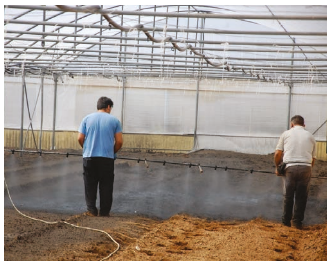
Applicazione dello strato di colore nero in serra (prova eseguita durante il progetto di ricerca CNR-CAAS).

confinata al suolo in virtù di adeguate proprietà ottiche che il film deve avere per garantire l'effetto di “intrappolamento” del calore. I test agronomici, effettuati confrontando il metodo della solarizzazione tradizionale con quello innovativo, evidenziano in quest'ultimo un incremento termico che parte dagli 8 °C in superficie fino ai 4 °C a profondità di 40 cm. In altri termini, rispetto alla solarizzazione tradizionale, si è avuto un aumento di temperatura a varie profondità del suolo, che va da 8 °C a 4 °C».