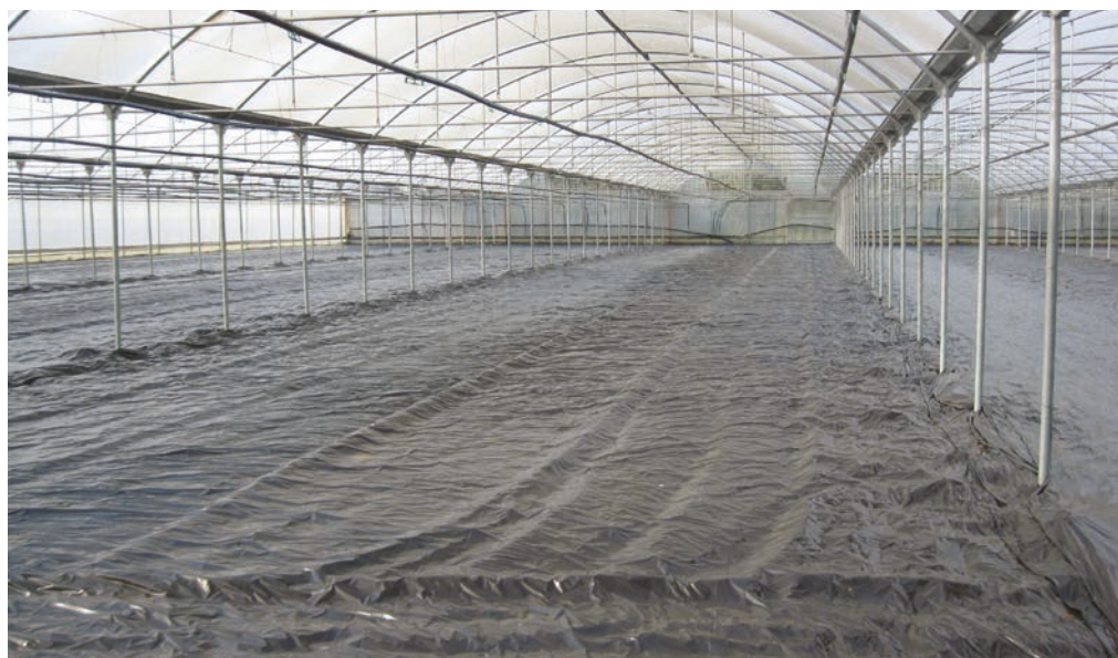
Solarizzazione tradizionale in una serra ubicata in Campania.